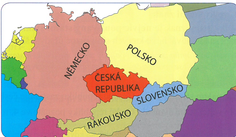
Česká republika a její sousední státy