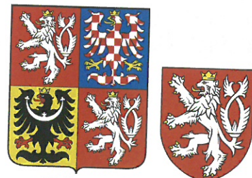
velký a malý státní znak České republiky