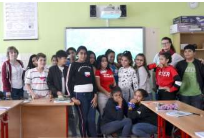
Naše žákyně, které pomáhaly při vyhodnocení soutěže zvané „Trikolóra“: